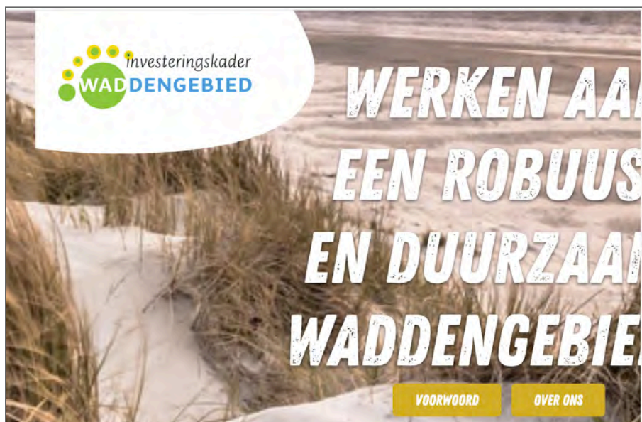
Figuur 7: bij het inzoomen wordt de titel deels onleesbaar