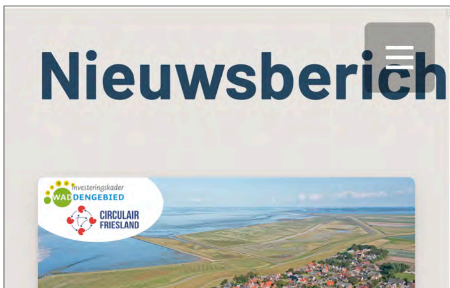
Figuur 8: bij het inzoomen gaat de menuknop door de titel heen