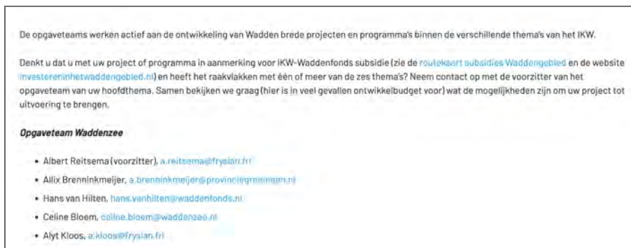
Figuur 1: links worden alleen aangegeven met een andere kleur