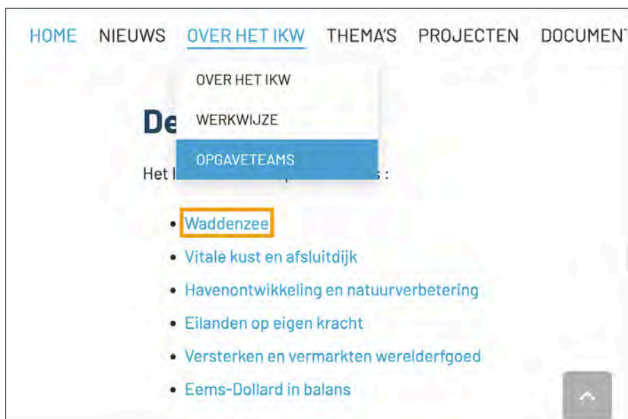
Figuur 6: het submenu kan niet met het toetsenbord worden gesloten en blijft dan content bedekken