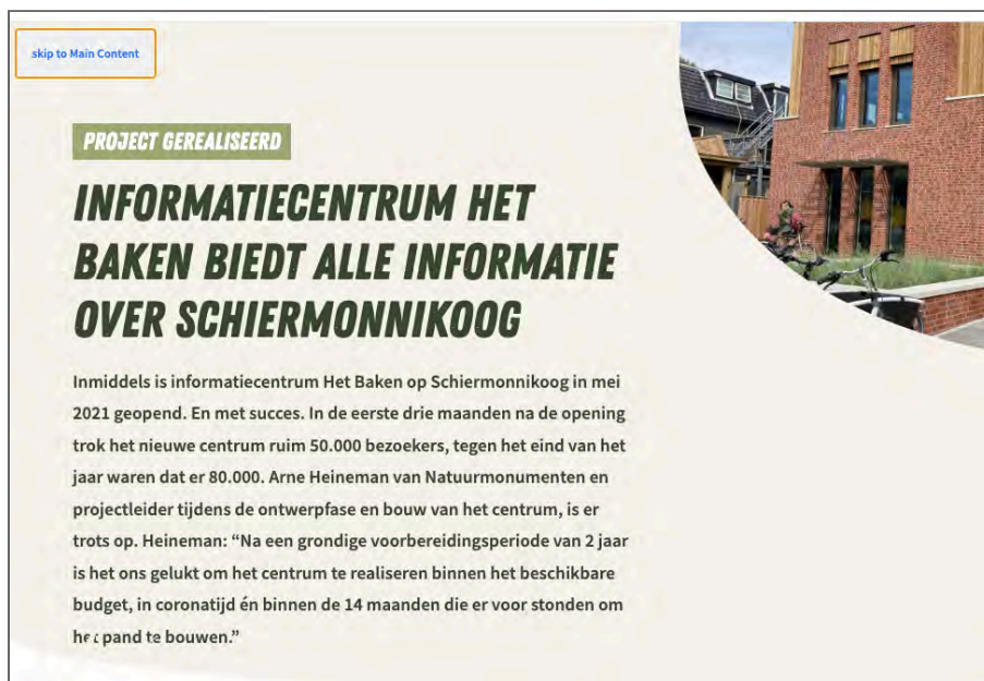
Figuur 4: de pagina heeft een skiplink, maar geen herhalende blokken