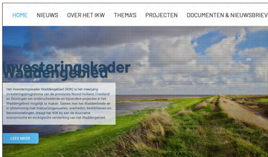
Figuur 5: bij het inzoomen vallen onderdelen weg en over elkaar heen