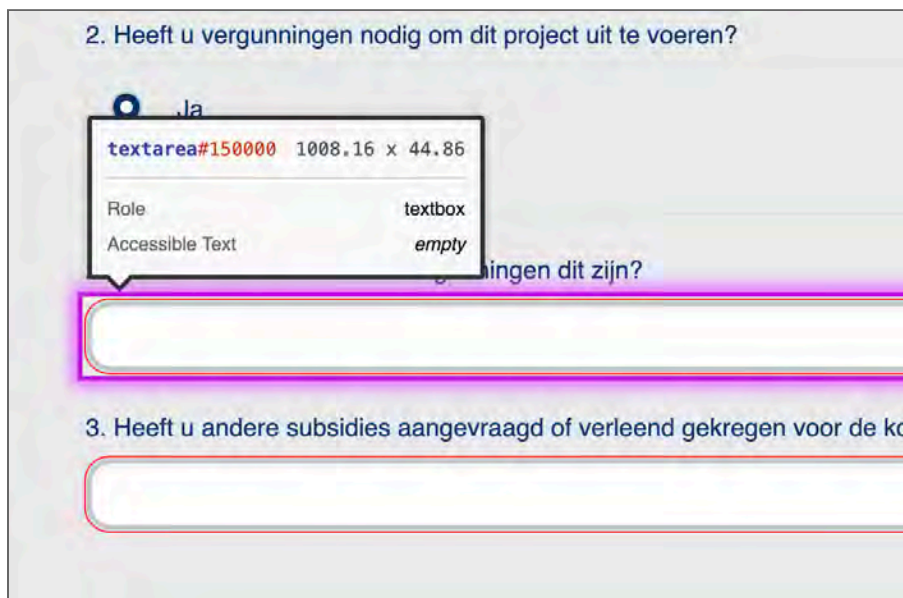
Figuur 2: de invoervelden hebben geen toegankelijk label