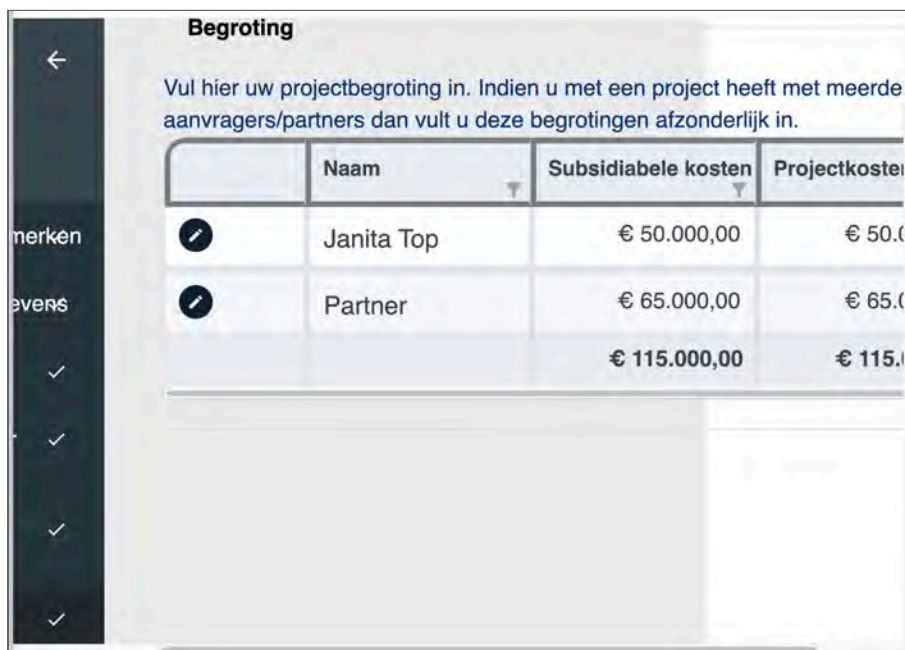
Figuur 5: bij het inzoomen moet in 2 richtingen gescrold worden om de content te kunnen lezen